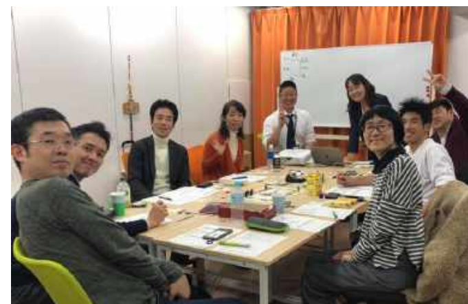
マネープランナー®ゲームの様子

理由3 普段の日常生活ですぐに実践することができるマネープランナー®講座は単なるゲームではなく普段の生活で実践できるスキルが身につきます。お金の流れや仕組みを知ることによって普段の生活に反映させることができ、いまずぐ実践することが可能です。